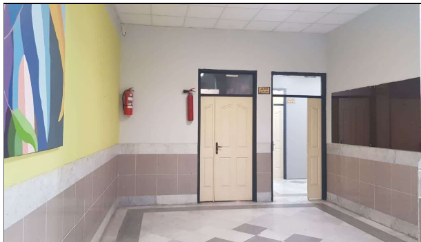
فضای ورودی مجموعه

۴- اتاق ۲ (با ابعاد ۹,۱۹ در ۵,۸۱) دارای دو قسمت مجزا است. قسمت اول برای جلسات و نشست ها با تعداد حدود ۳۰ نفر برای تمام اعضای کانون شکوفایی خلاقیت و نوآوری، اعضای انجمن ها و کانون ها در نظر گرفته شود. در قسمت دوم فضایی کاملا مستقل برای کانون هلال احمر تعبیه شود.