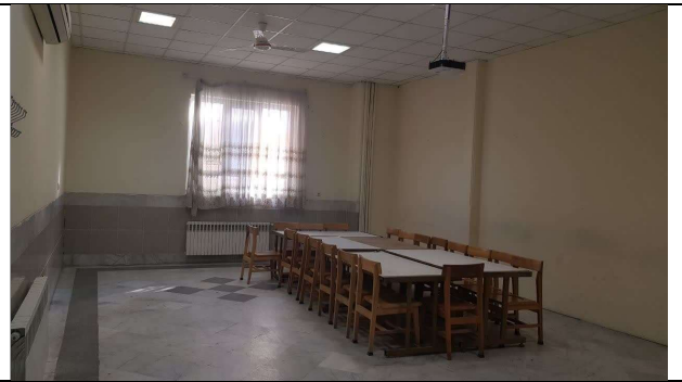
تصویر اتاق ۲ از قسمت تخته