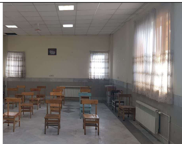
تصویر اتاق ۱ از قسمت تخته