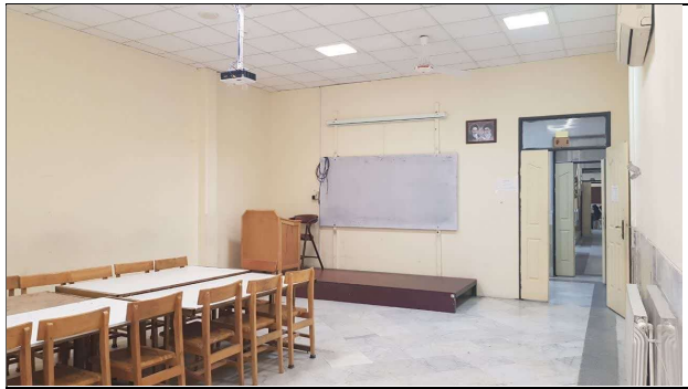
تصویر اتاق ۲ از قسمت انتهای کلاس