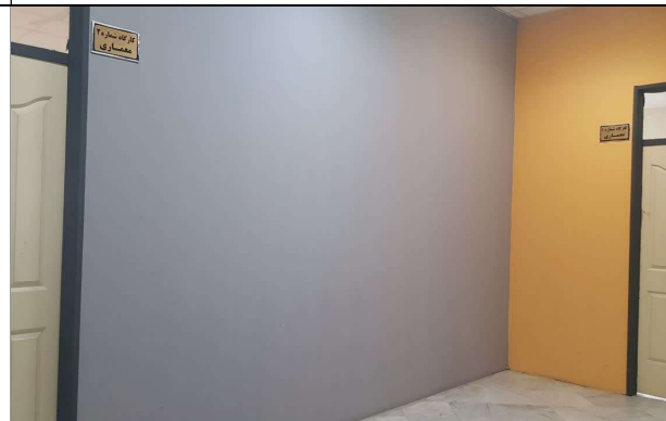
فضای مشترک بین دو اتاق ۱ و ۲